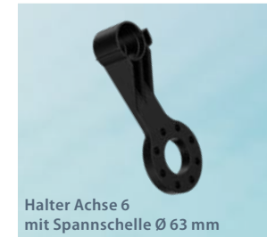
Halter Achse 6 mit Spannschelle Ø 63 mm 3