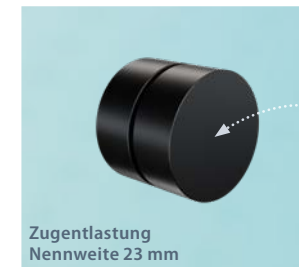
Zugentlastung Nennweite 23 mm 5