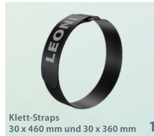
Klett-Straps 30 x 460 mm und 30 x 360 mm 1