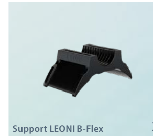
Support LEONI B-Flex 2