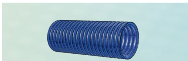
コルゲートホース LEONI proflex 17 mm 及び 23 mm 青色 4