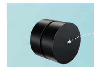
Φ 23 mm 用ケーブルスター 5