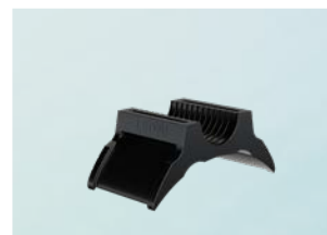
Держатель LEONI B-Flex 2