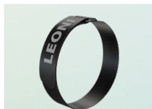
Фиксатор на липучке 30 x 460 мм и 30 x 360 мм 1

Компоненты для легковесных и коллаборативных роботов