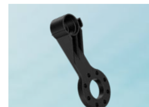
Ось держателя 6 с опорой для запястья Ø 63 мм 3