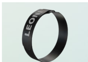
尼龙搭扣 30 x 460 mm and 30 x 360 mm 1