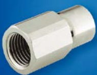
Typ A – Gerade