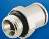
Typ E – Gerade