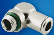
Typ D – Winkel 90°