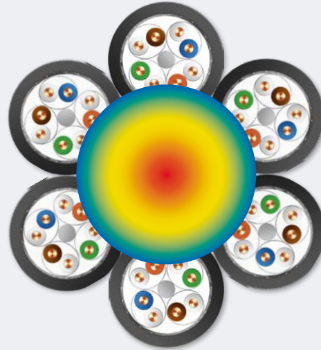
Anwendungsbeispiel für ein Ethernetkabelbündel mit PoE-Nutzung mit dabei entstehender Wärmeentwicklung